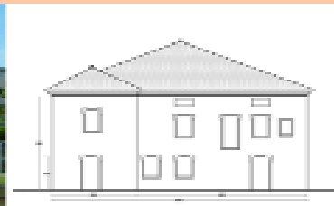
RISTRUTTURAZIONE CASA BAROTTO